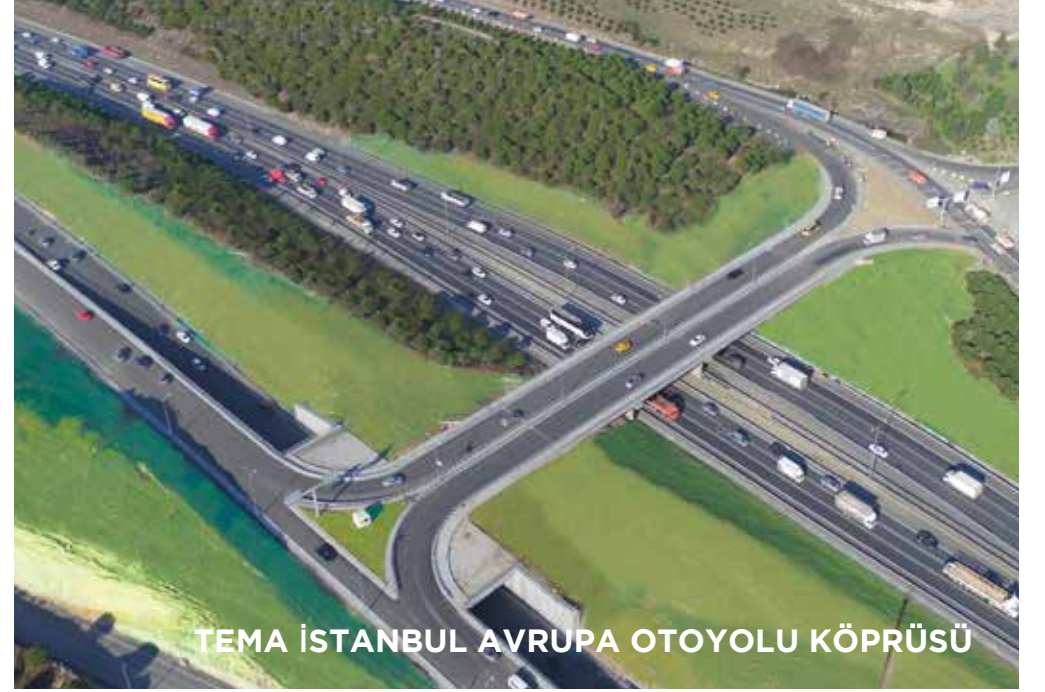
TEMA İSTANBUL AVRUPA OTOYOLU KÖPRÜSÜ