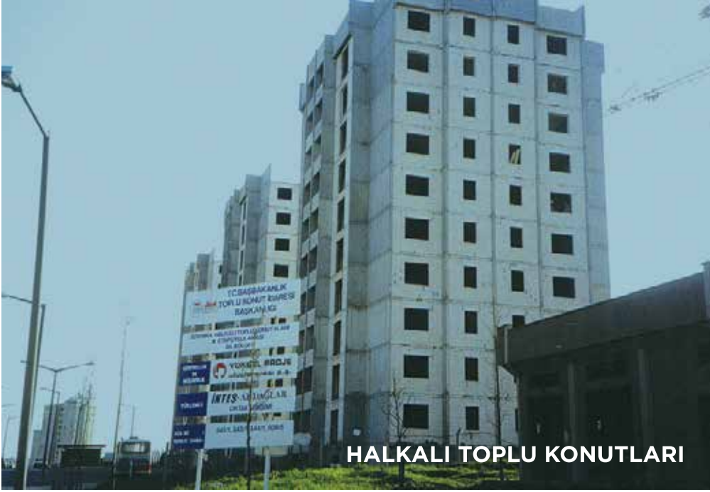
HALKALI TOPLU KONUTLARI