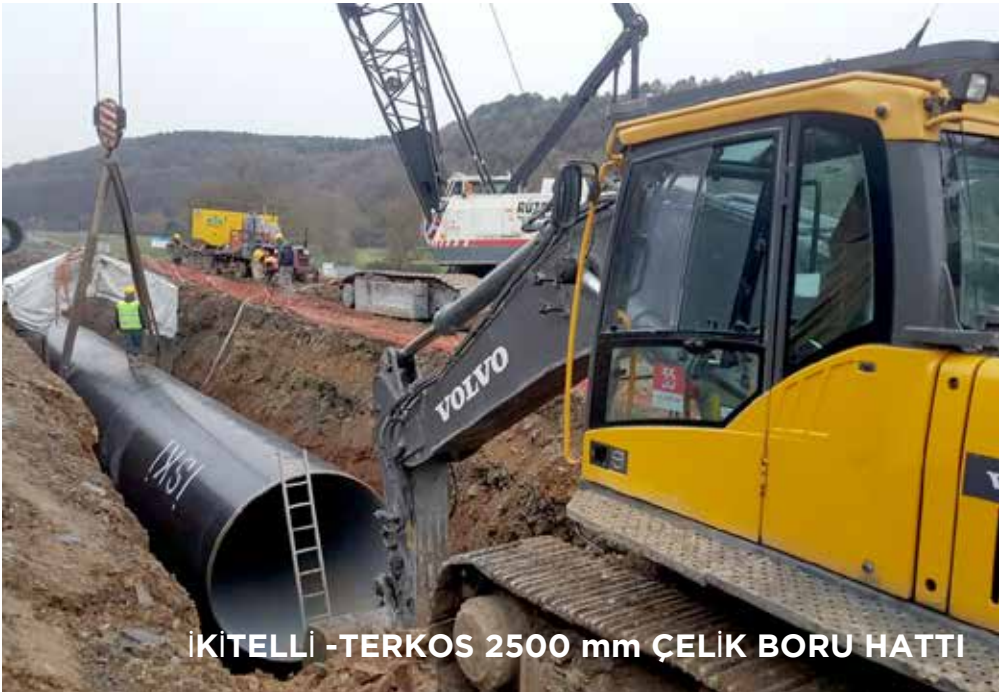
İKİTELLİ -TERKOS 2500 mm ÇELİK BORU HATTI