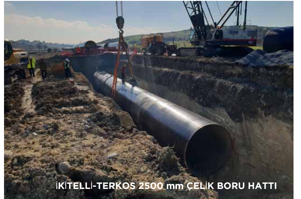
İKİTELLİ-TERKOS 2500 mm ÇELİK BORU HATTI